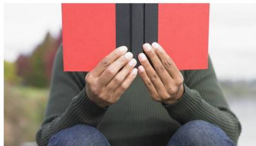
Ilustrační foto

Na rozvoj čtenářské gramotnosti napříč předměty na druhém stupni základní školy bude zaměřen on-line seminář, který tento čtvrtek ve 14 hodin pořádá Místní akční skupina Český les.